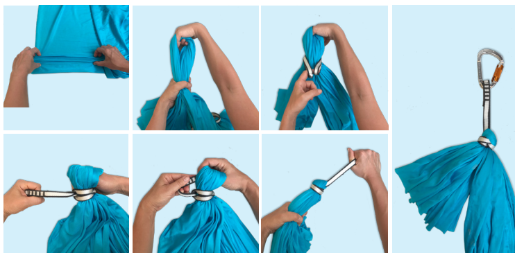
Die Montage eines U-Fly in 7 Schritten.