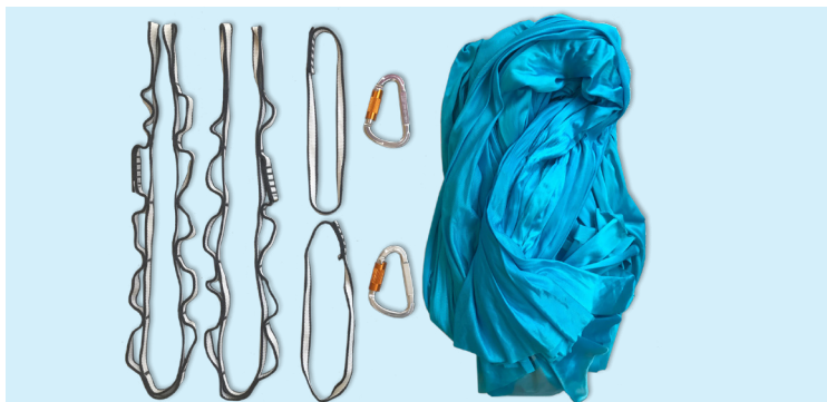
Übersicht: Die Komponenten eines U-Fly